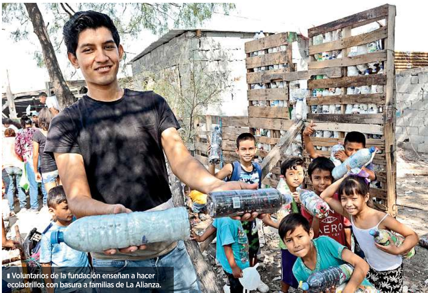
Voluntarios de la fundación enseñan a hacer ecoladrillos con basura a familias de La Alianza.

Con el programa 'Por un mundo mejor', la fundación Enrique Yturria García enseña a 300 familias a aprovechar la basura para generar empleos, construir viviendas y mejorar su entorno